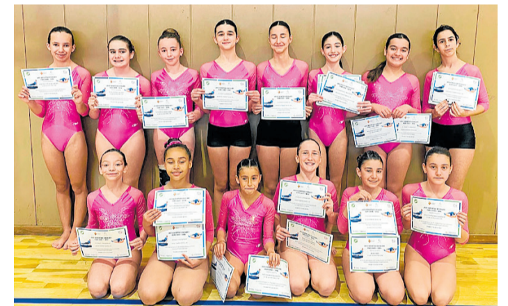
Gimnastes alevins i infantils del Club Gelida Fem Gym | CE