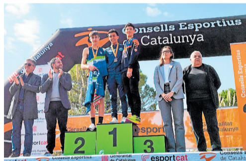
Diferents moments que es van poder gaudir aquest diumenge passat amb la Final Nacional de Cros Escolar | CE